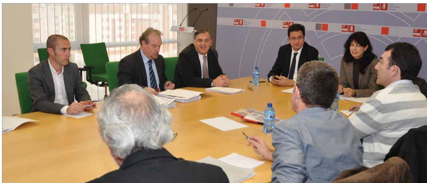
El grupo socialista seguirá denunciando las medidas tomadas por Herrera.

Es una incoherencia que la Junta no aprobase los presupuestos de este año con la excusa de no tener datos de previsiones fiables y ahora tomen medidas como el céntimo sanitario