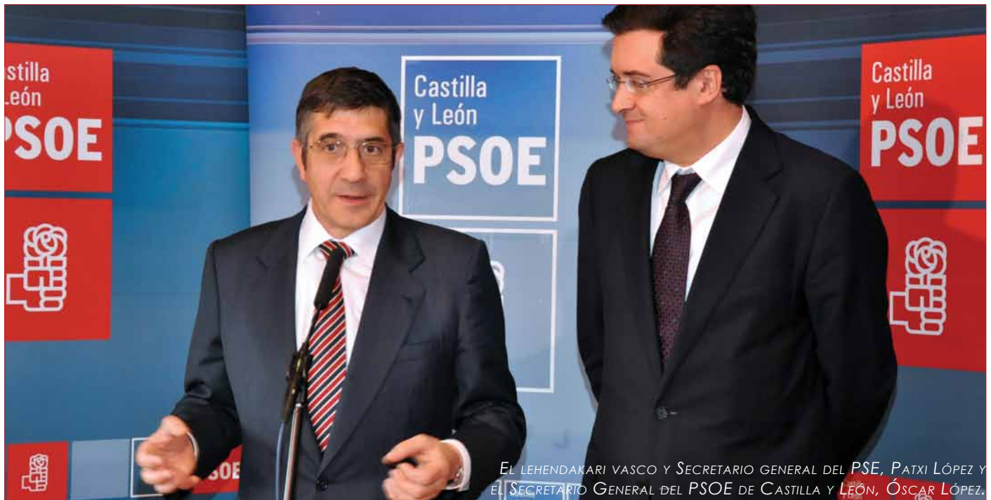
EL LEHENDAKARI VASCO Y SECRETARIO GENERAL DEL PSE, PATXI LÓPEZ Y EL SECRETARIO GENERAL DEL PSOE DE CASTILLA Y LEÓN, ÓSCAR LÓPEZ.