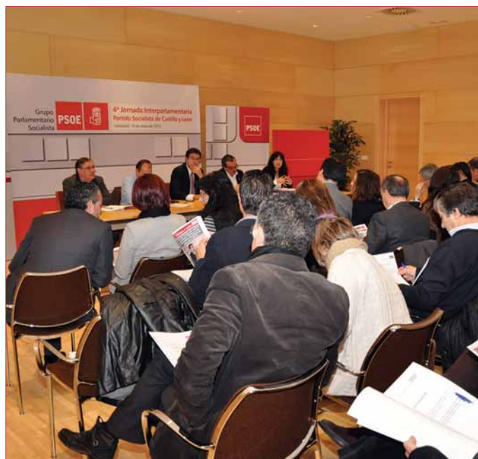
Todos los cargos públicos se reunieron en las Cortes.