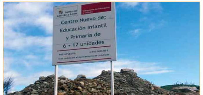
Los niños de estas edades están ubicados en el instituto.

ma Crecemos en la provincia de Segovia frente a los 23 que existen en la actualidad, por lo que, en lugar de llegar únicamente a 254 niños, podría alcanzar a 434 niños de la provincia. "No entendemos como el PP presume de un programa parado, anquilosado desde hace tres años", señala.