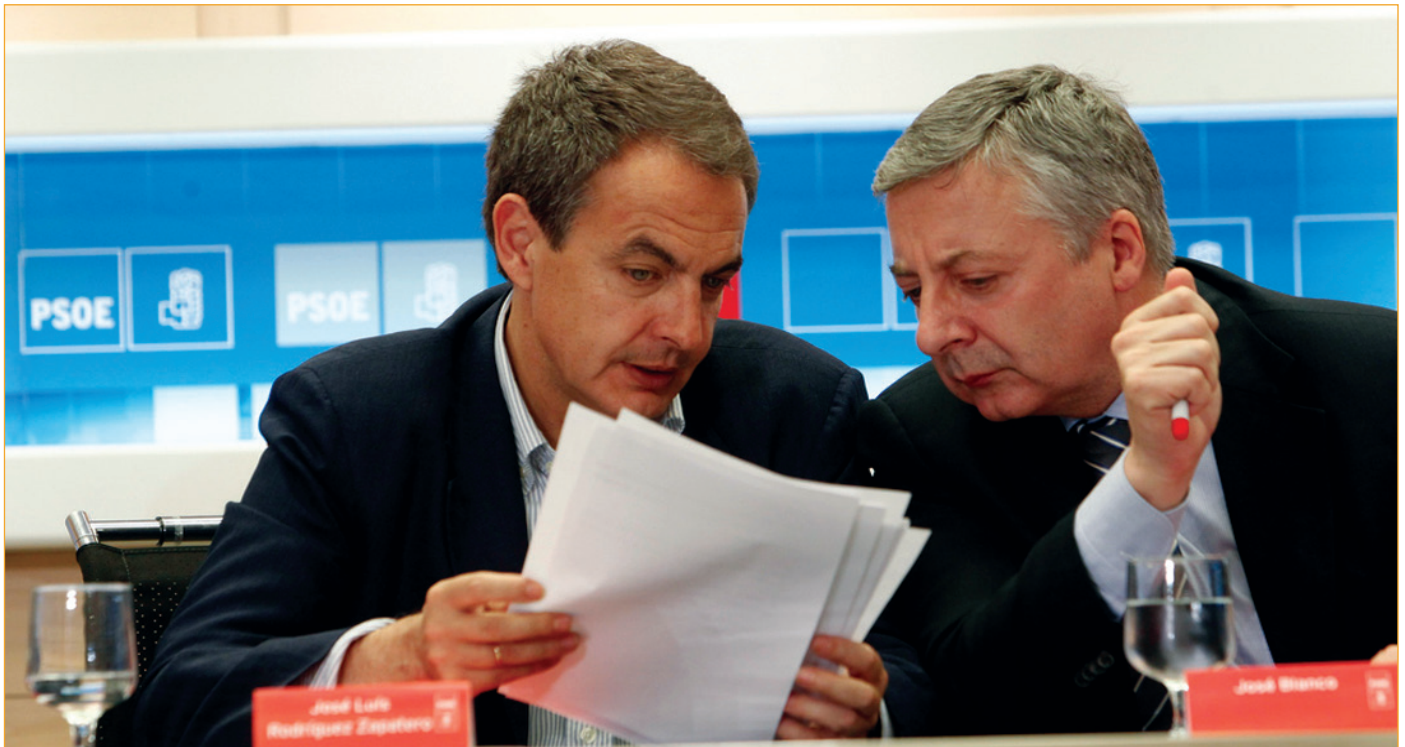
José Luis Rodríguez Zapatero, Presidente del Gobierno.

Entre las medidas incluidas en el decreto-ley aprobado por el Gobierno destaca la rebaja del 8 al 4 % el IVA que grava la compra de vivienda nueva, una medida "excepcional y temporal" que se extenderá hasta el 31 de diciembre y con la que el Gobierno pretende dar salida al stock de casas construidas que permanecen sin vender, y favorecer la actividad del sector de la construcción y la generación de empleo, informaron hoy el ministro de Fomento, José Blanco, y la vicepresidenta