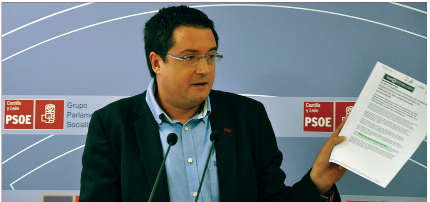
Óscar López, Secretario General del PSOE de Castilla y León.