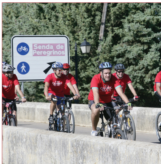
El pelotón cilista en un tramo del recorrido

de las ayudas de 400 euros a quienes ya han agotado todas las prestaciones de desempleo existentes. Por último, aseguró que la reforma de la Constitución para fijar el límite de