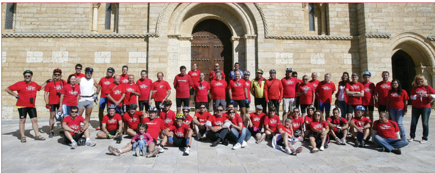
Foto de Grupo del PURO CAMBIO TOUR 2011