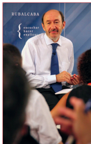
Alfredo Pérez Rubalcaba

Rubalcaba recordó que las diputaciones son una estructura cuya regulación y competencias proceden de 1836. Las 38 diputaciones de régimen común están integradas en la actualidad por 1.037 diputados provinciales y manejan un presupuesto de 6.000 millones de euros, buena parte de ellos destinados a su funcionamiento. El candidato recordó que, del total de este presupuesto, un 30% lo absorbe la partida de personal, con partidas que se pueden eliminar en lo tocante a salarios de cargos políticos y de sus asesores y personal eventual de confianza. También puede recortarse en lo relativo a gastos corrientes "prescindibles", que son todos aquellos "asociados al carácter político de las diputaciones". En total, el candidato calcula que el gasto prescindible de las actuales diputaciones representa