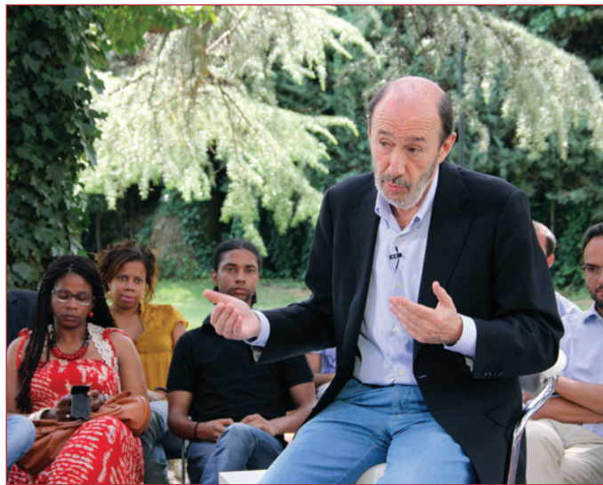
Alfredo Pérez Rubalcaba

La directora del Comité Electoral, Elena Valenciano, presentó la nueva iniciativa Diálogos con Rubalcaba, con la cual el PSOE pretende acercar la campaña a la ciudadanía. La iniciativa parte del mundo de las redes, pero tendrá una serie de hitos que cristalizarán en encuentros personales de grupos de ciudadanos y ciudadanas con el candidato socialista a la Presidencia, Alfredo Pérez Rubalcaba, que podrán hablar con él "sin trampa ni cartón y sin filtros". En la presentación del evento, Elena Valenciano destacó que Diálogos con Rubalcaba es una iniciativa innovadora "y que también tiene sus riesgos", reconoció, y que se enmarca dentro de esta campaña personal y diferente que está poniendo en marcha el candidato del PSOE. La iniciativa completa el compromiso de Escuchar,