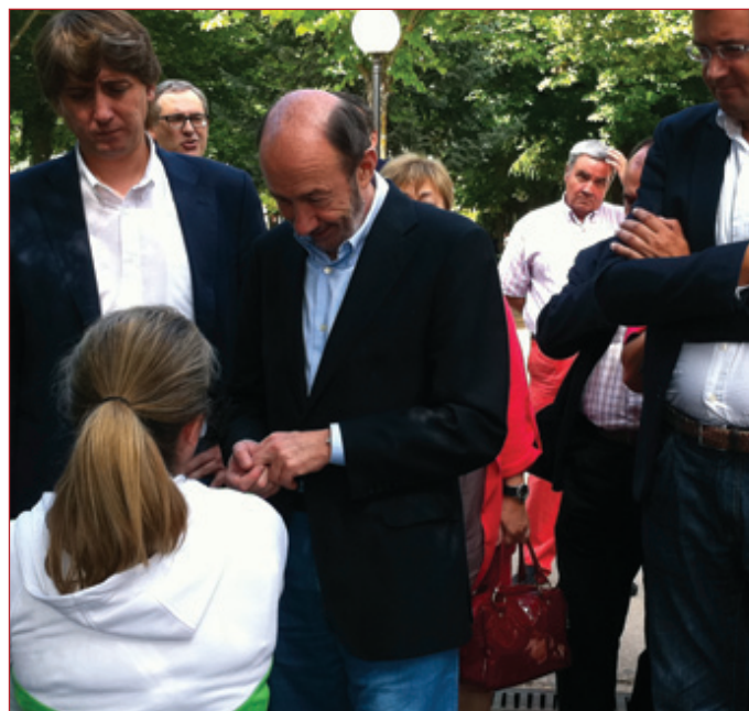
Recorriendo las calles de Soria

El líder de los socialistas de Castilla y León, Óscar López, propuso "escuchar", "hacer" y "explicar", al igual que Pérez Rubalcaba, para hacer una política en la "calle" y basada en la "cercanía" y el "contacto directo con la gente". Precisamente, señaló que en esa línea se enmarca la visita del ex ministro del Interior a la ciudad de Soria, la primera capital de Castilla y León a la que se traslada desde el anuncio de adelanto electoral. En ese sentido, López, que acompañó a Pérez Rubalcaba en su recorrido por la calles de Soria, afirmó: "Siempre he creído en la política de cercanía y de contacto directo con la gente". Así valoró el acto político del candidato socialista, el primero que acoge la Comunidad desde que el presidente del Gobierno, José Luis Rodríguez Zapatero, comunicara su decisión de convocar las elecciones generales el 20 de noviembre. Asimismo, López en