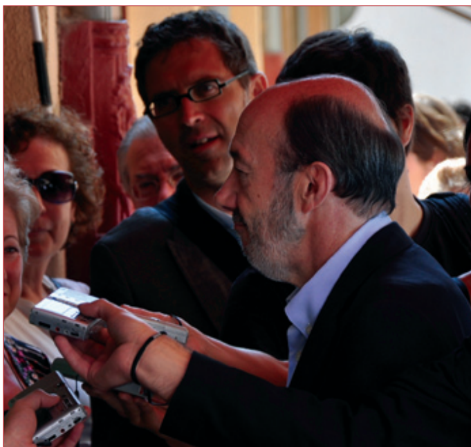
Rubalcaba se detuvo para charlar con la gente

Mercado de Abastos se paró a charlar con algunos tenderos para preguntarles por los efectos de la crisis en la venta de sus productos. Pérez Rubalcaba buscó, de esta forma, conocer de forma directa las inquietudes de los ciudadanos y los problemas de su día a día más allá de lo que dicen las agencias de calificación, la prima de riesgo o la Bolsa.